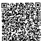
"สิ่งที่ส่งมาด้วย"